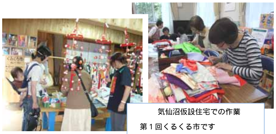
気仙沼仮設住宅での作業 第 1 回くるくる市です