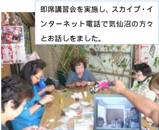
即席講習会を実施し、スカイプ・インターネット電話で気仙沼の方々とお話ししました。