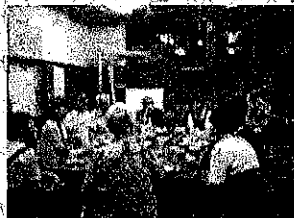
ぼうわうの皆さんと夕食