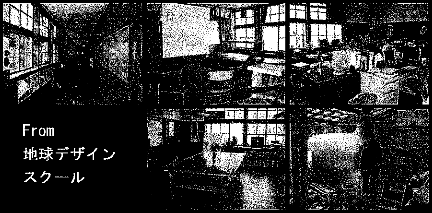
地球デザインスクール内風景

発行：NPO 法人グリーンコンシューマー大阪ネットワーク ●〒541-0046 大阪市中央区平野町 3-1-7 大阪屋セントラルビル 6F ●TEL090-8989-5182 (山口) ●年会費 1 口 2000 円 (個人 1 口以上、学生半口以上、団体 3 口以上、賛助会員 (会社) 5 口以上) ●郵便振替 00920-8-154437 ●http://www.mmjp.or.jp/gcon/ ●gcon-osaka@mail.goo.ne.jp